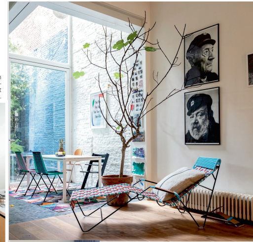
Op de voorgrond staat een Tucurınca-lounges en een vijgenboom die van buiten naar binnen verhuisd is.