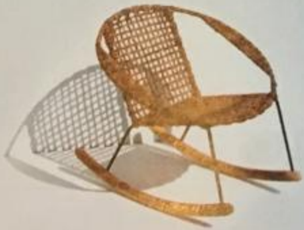
Deze schommelstoel van Tucurınca is gemaakt van geweven bananenbladeren.