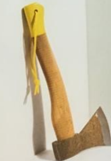
The Axe: elke bij komt in een geschenkverpakking en kan worden opgehangen aan een kleurrijk koord.

we eerst een vraag krijgen van een klant.' Dat 'ding' zijn hoogwaardige meubels en accessoires met een serieuze knipoog. 'Onze objecten hebben een hoge esthetische waarde, ze zijn gewoon mooi om naar te kijken. Maar ze werken ook perfect, de blaaspook doet bijvoorbeeld exact wat hij moet doen: vuur aanwakkeren.' En omdat Maister zich dagdagelijks bezighoudt met branding, verpakkingen, fotografie en commu-