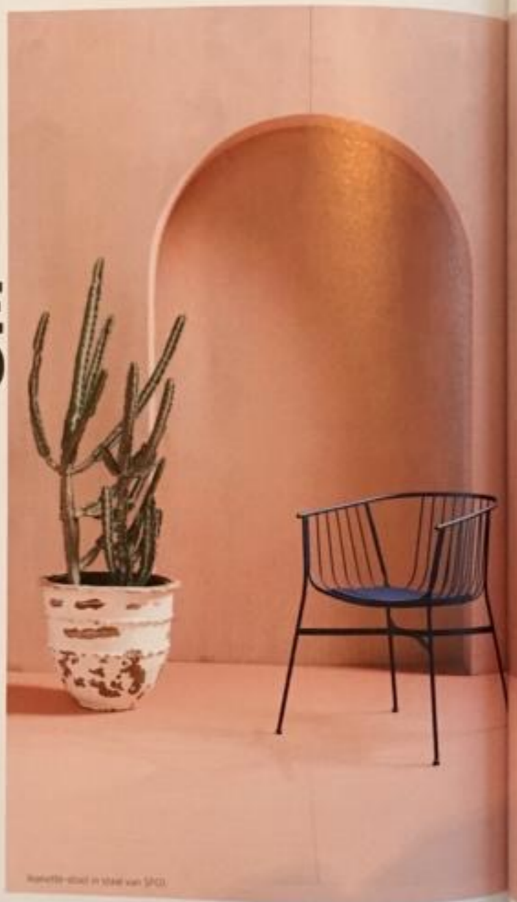
Wire chair - steel in steel van SPOL